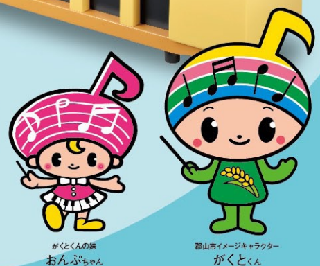
がくとんの妹 おんぶちゃん