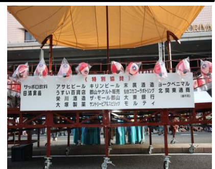
6. 踊り流し(看板への社名表示)