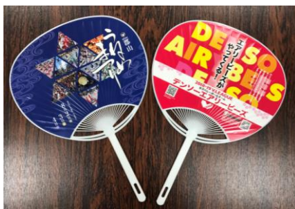
4. うちわ(裏面への広告掲載)