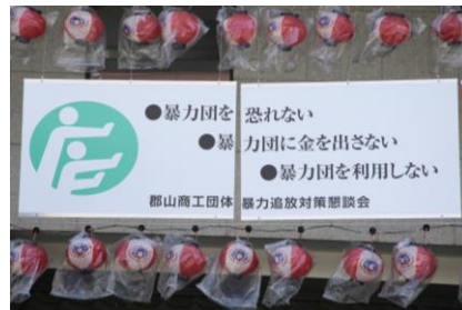
2. 広告看板(1枚・横2400×縦800mm・両面)