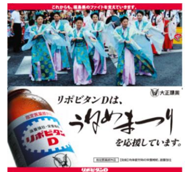
3. バナー広告(横2500×縦2500mm・片面)