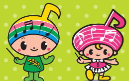
郡山市イメージキャラクター がくとくん おんぶちゃん