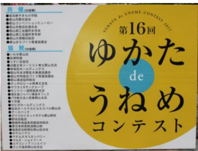
4. ゆかたコンテスト