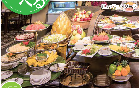
1日目 夕食 SEN TAY HO (センタイホー) にて ウェルカムパーティー-インターナショナルビュッフェ