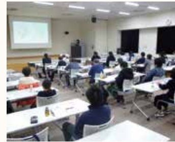
販売士資格更新講習会の様子

昭和44年に「営業士検定」として、販売士検定(現リテールマーケティング検定)が始まり、昭和48年度には、「郡山営業士会」が発足、昭和50年に販売士検定の変更に伴い、現在の「郡山販売士会」として活動しています。