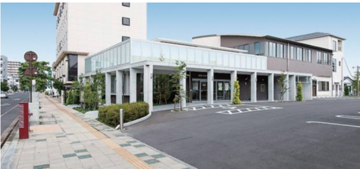
須賀川信用金庫 本店営業部(須賀川市宮先町31番地)

「創業の趣意を体し、地縁性金融機関として地域の発展に奉仕する」を基本方針に、須賀川市、郡山市、鏡石町、石川町、古殿町、天栄村、平田村、玉川村及び矢吹町の一部の2市4町3村をエリアとし、店舗数14店舗、出張所(店外ATM)5を配し、多様な顧客ニーズに応え、地域とともに共生する地縁性金融機関として営業活動を行っております。