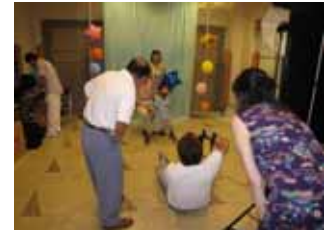
【夏の思い出に、プロによる記念撮影】