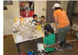
【大勢の方がダルマの絵付けに挑戦しました】