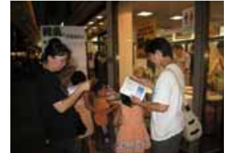
【湖南の特産品や観光情報を求める人で賑わう】