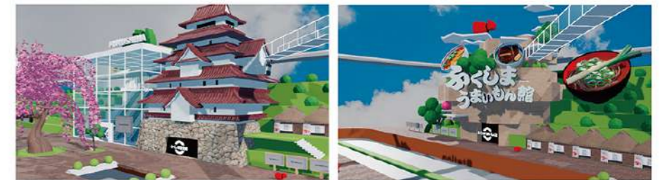
ふくしま観光城(外観)