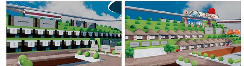
ふくしま商店街(テナント・外観)

いつでも、どこでも 離れている友達や家族と「旅」ができる。 そんな体験をしてみませんか？