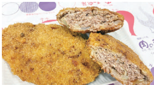
▲大人気の特大メンチ

このメンチを始めたのは、4代目である父。「店の認知度をもっと広げたい。いつかテレビに取り上げられたら」そんな思いから生まれた看板商品だったという。原材料費の高騰により「売れば売るほど赤字なん