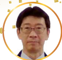
日本政策金融公庫 郡山支店 支店長