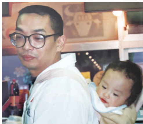
▲幼少期の五代目店主、父との一枚