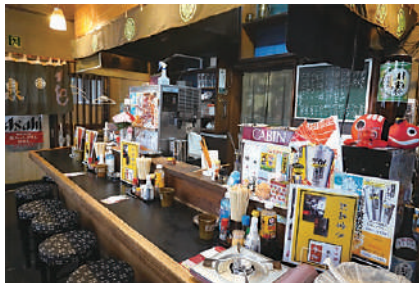
▲和泉屋肉店が経営する「やきとり和泉」

創業は、明治42(1909)年まで遡る。現店主の高祖父が、まだ郡山市では精肉店そのものが珍しかった時代に店を開い