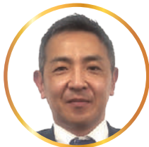
福島県信用保証協会 郡山支店長

さて、昨年を顧みますと、長引く物価の高騰や賃金の上昇、人手不足、そして米国の関税措置による影響など、多くの課題が