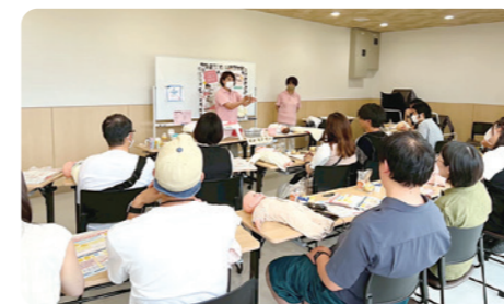
子育て世帯向けイベント開催 妊娠中・子育て中家族向けに講座や定期的なイベント開催しています。