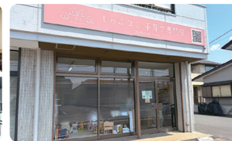
しゅふコミ子育て専門店運営 福島県郡山市桑野 子育て講座・遊び場を行う店舗を運営しています。