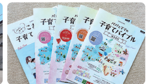
子育てバイブル福島県版発行 5年連続発行!福島県内22市町村へ母子手帳と一緒に配布する冊子を作成しています。