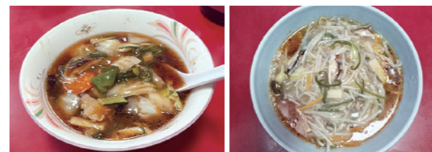
はな巻めん もやしあんかけらーめん